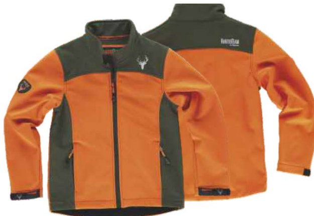
naranja a.v./verde caza

Tejido: 96% Poliéster 4% Elastano (300 g/m2)